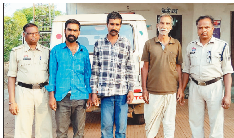
कानून हाथ में लेने वालों को नहीं बख्शेंगे- एसएसपी