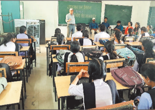
भागीदारी आवश्यक है।

रायगढ़। आयुक्त कार्यालय एवं कलेक्टर सारंगढ़ के निर्देशों के परिपालन में शासकीय शहीद वीर नारायण सिंह महाविद्यालय बिलाईगढ़ में 23 अप्रैल को ज्ञान भारतम मिशन के संबंध में विशेष जागरूकता गोष्ठी का आयोजन किया गया। कार्यक्रम दो चरणों में प्रथम कला संकाय के कक्ष क्रमांक 03 में अपराह्न 01 से 2 बजे तक तथा द्वितीय विज्ञान संकाय के कक्ष क्रमांक 21 में अपराह्न 3 से 04 बजे तक संपन्न हुआ।